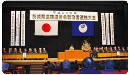
↑県知事をはじめ、たくさんのご来賓の方に出席いただきました。