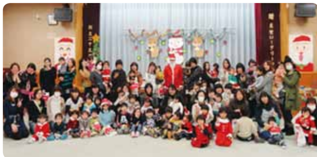
↑ 子育て支援センター真壁