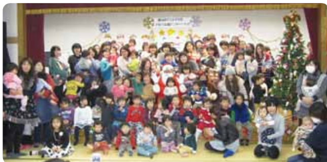
↑ 子育て支援センター岩瀬

また、どちらの会場でも、子供たちはサンタさんからのプレゼントにワクワクドキドキ、目を輝かせていました。